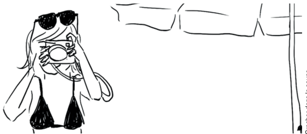
Cracher dans la soupe