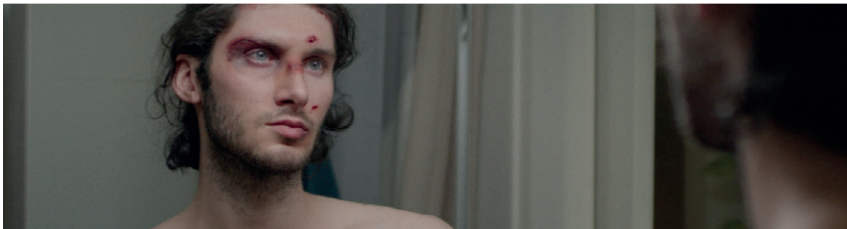
Tout va bien