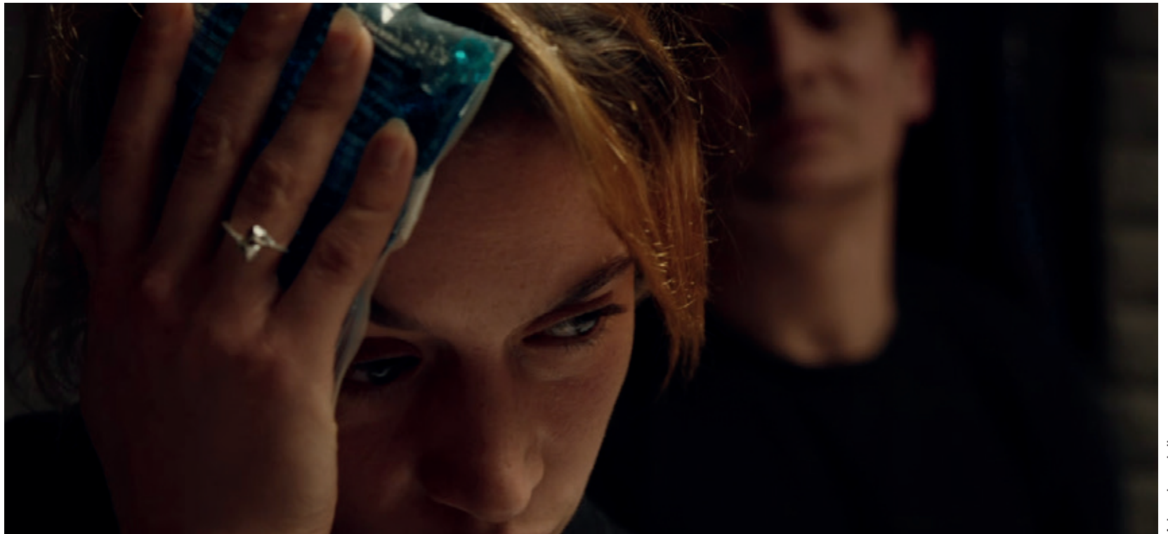
A bas le soleil