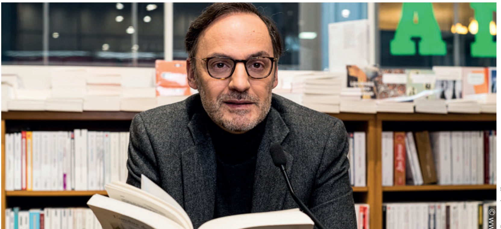
Livresse des livres