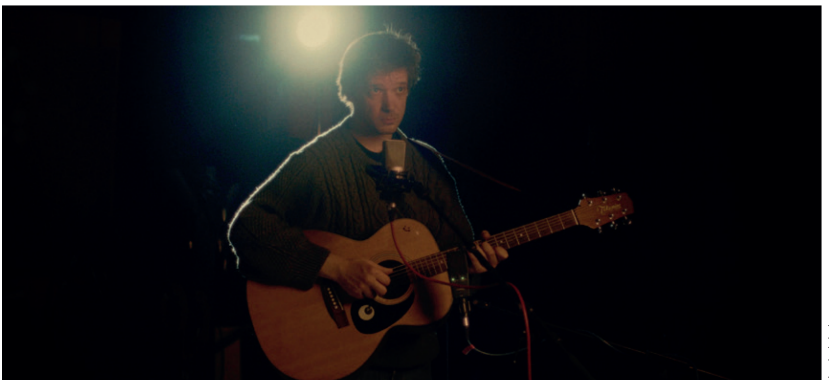
Un pied dedans