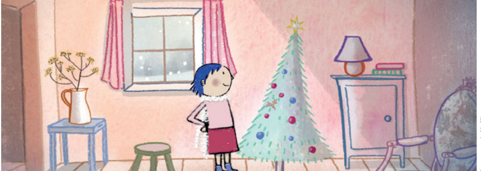
La grange de Noël