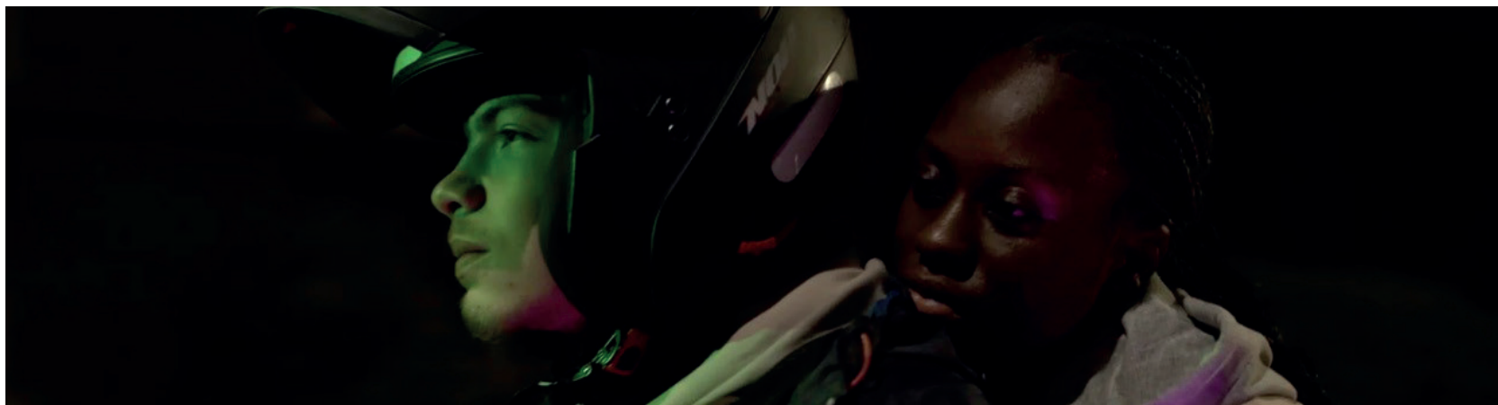
La vague verte