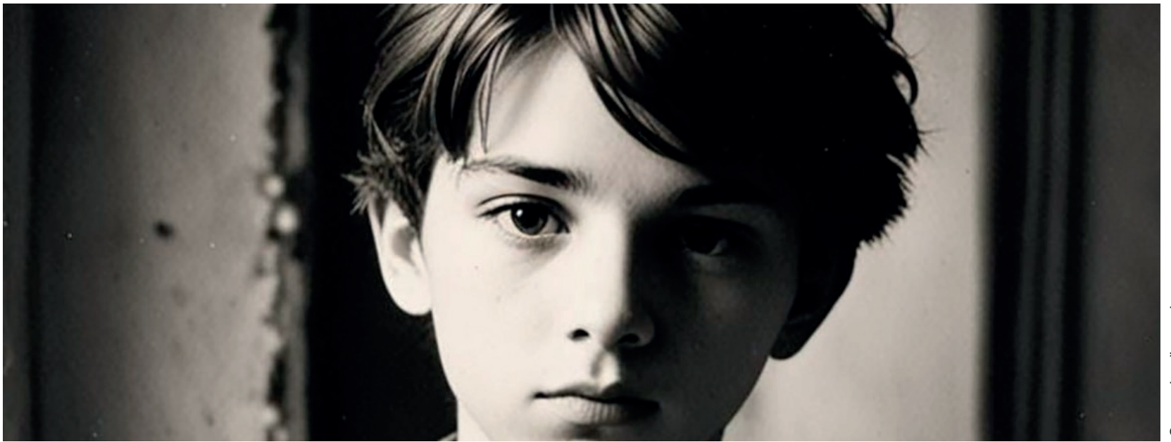
Souvenirs d'un ami