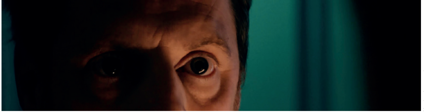
Un dernier pour la route