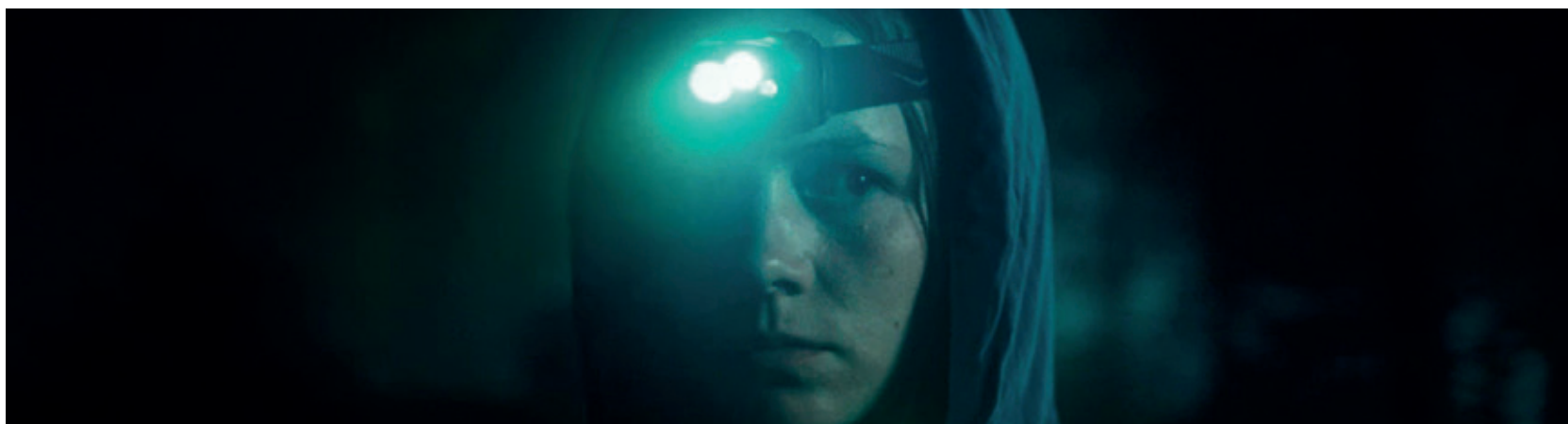
Naissance d'un feu