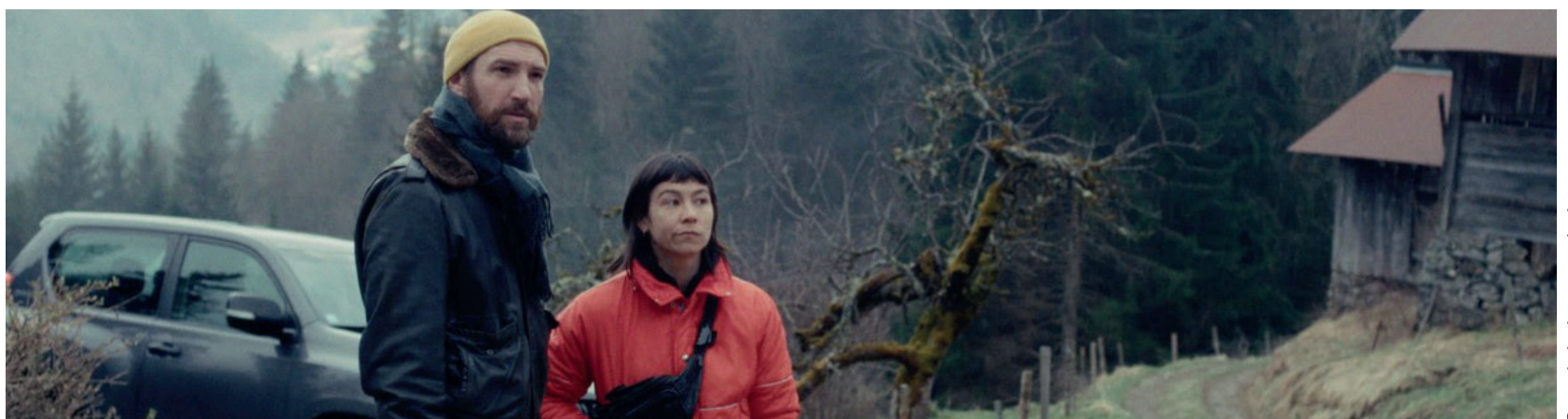
Ce qui n'existe pas n'existe pas