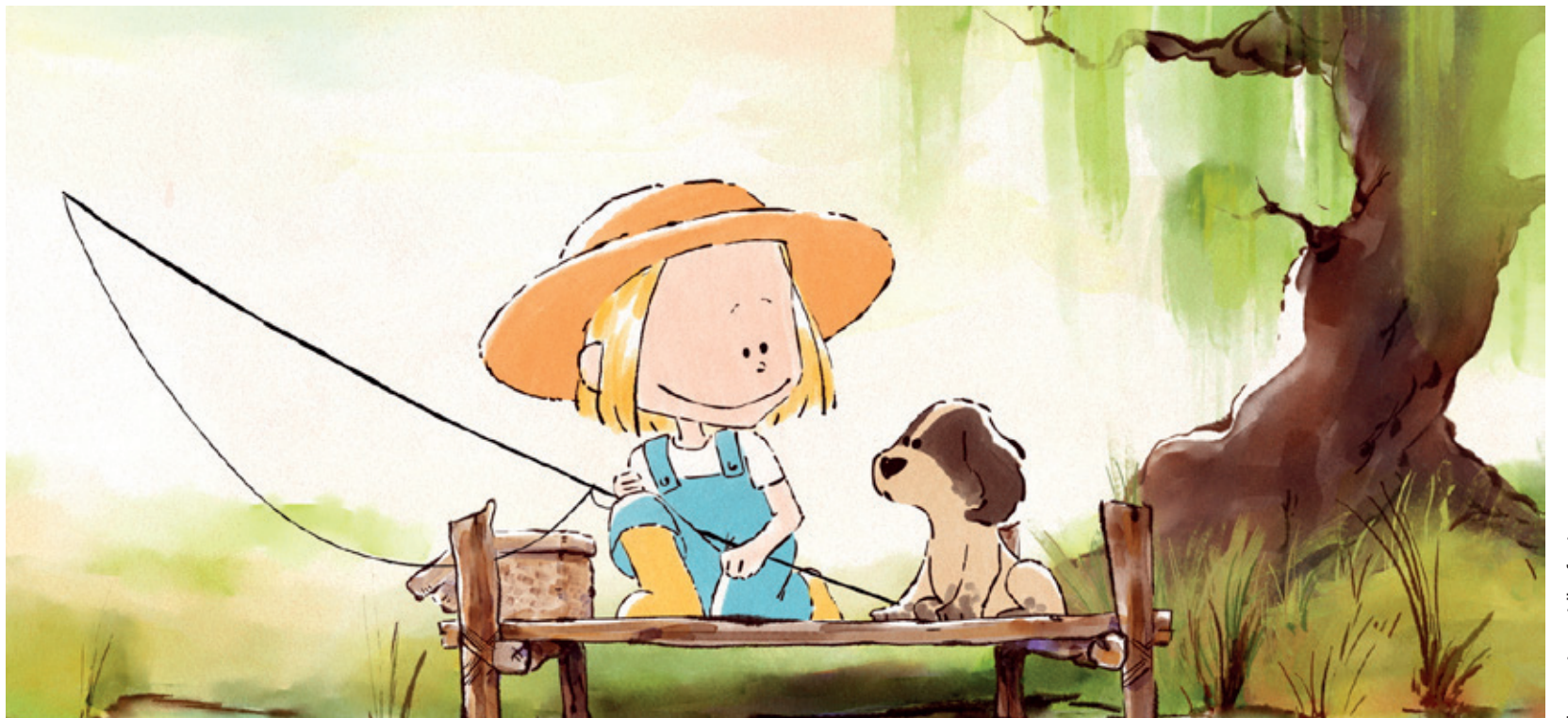
La cartpe et l'enfant