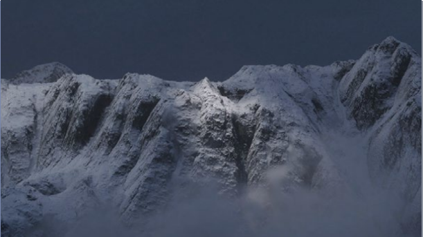
arménien, sous-titré en français, 9 min France - 2024

Un dialogue entre le mont Ararat et Le Mont Analogue de René Daumal réfléchit au paradoxe de leur présence visible mais inaccessible en tant que montagnes intérieures. Il interroge la manière dont les montagnes ne sont pas seulement des repères physiques, mais aussi des constructions métaphysiques qui façonnent notre perception de soi. Le mont Ararat, avec son sommet volcanique de 5 137 mètres visible à l'horizon, demeure toujours à portée de vue, mais inaccessible en raison des forces du conflit géopolitique.