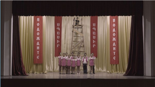
arménien, farsi et russe, sous-titré en français, 17 min Arménie, Iran et Canada - 2020

A Passage est un film hybride situé dans les vallées de la région de Syunik, au sud de l'Arménie. Il n'y a pas si longtemps, l'ancienne voie ferrée légendaire reliant Erevan à Bakou a été détruite dans cette zone frontalière, où une « zone économique libre » doit désormais voir le jour. Donnant la même importance au mythe, au ragot et au fait avéré, le film explore les processus de militarisation et de néolibéralisation accélérées dans le sud de l'Arménie, où les strates de l'histoire se mêlent à l'incertitude d'un futur proche.