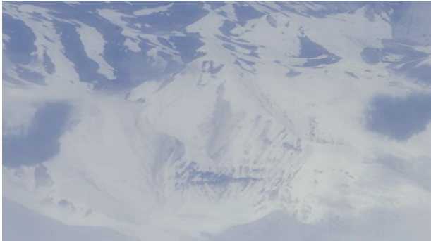
turc sous-titré en français, 18 min Allemagne et Turquie - 2020

Un monstre lacustre ancestral résiste à tomber dans l'oubli, et vit désormais dans les récits de quelques-uns. Son mythe remonte aux ancêtres des Arméniens et des Kurdes autour du lac Van, une région qui a connu l'épuration ethnique de ces deux peuples. À la croisée des mondes mythologique, politique et personnel, différentes formes d'effacement se dissimulent. Ici, même les monstres sont politisés, mais la topographie garde sa propre mémoire. Il a le blues mythologique.