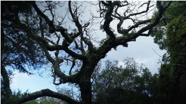
arménien et anglais, sous-titré en français, 14 min Arménie, Begique, Portugal et Hongrie - 2024