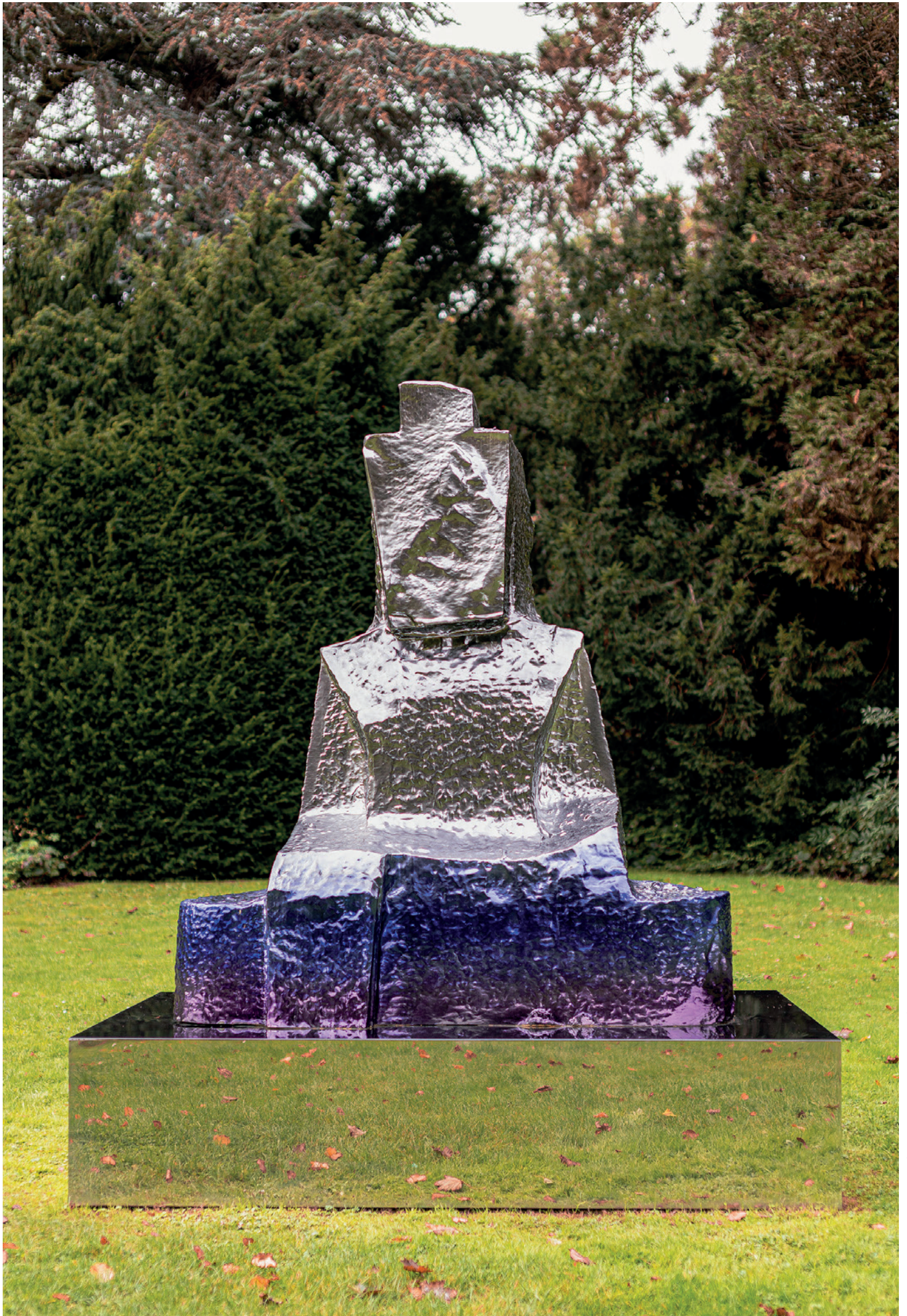
Xavier MARY, Oh my Buddha (XL, sunset gradient version) 2022