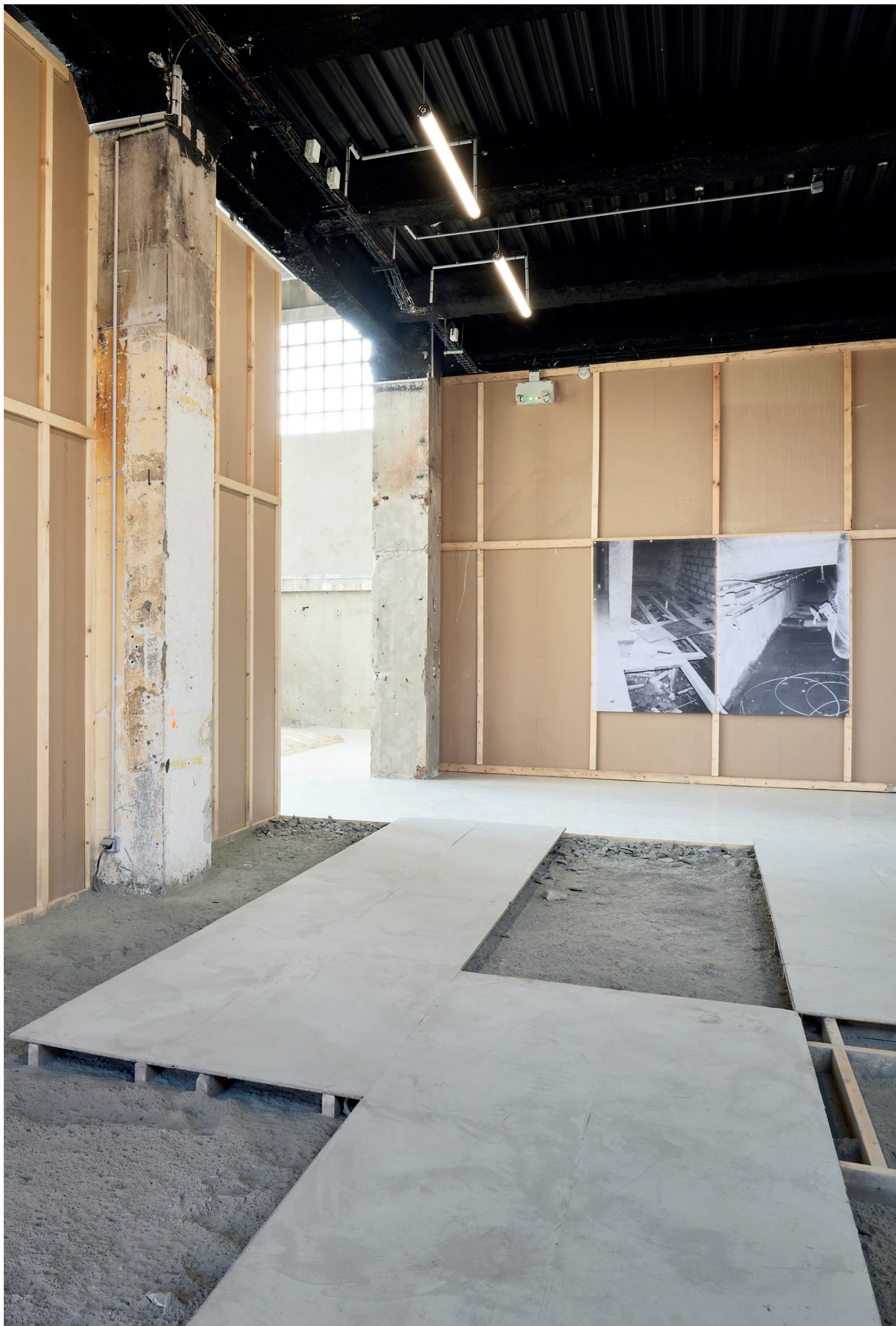
Yoel Pytowski, Fondations, 2023, Fondation Fiminco, Paris, France ,Vidéo ,Impressions sur treillis-pvc, bois, plaques de plâtre, néon, béton,ciment non mélangé, feuilles