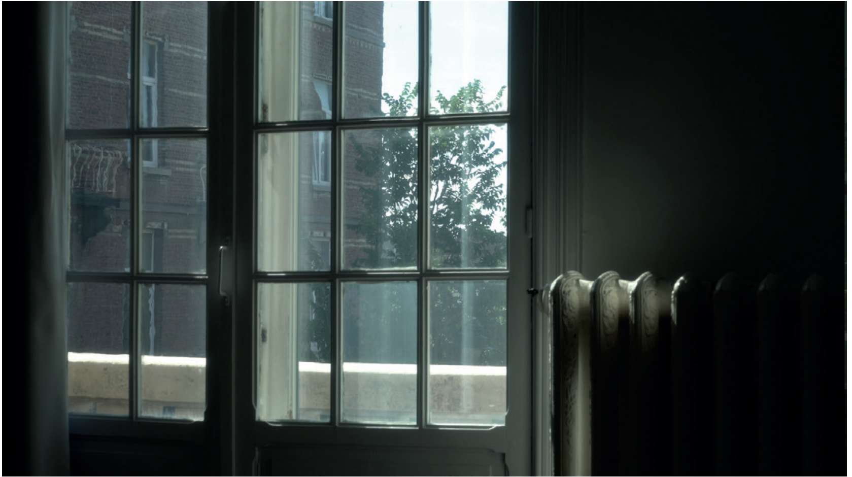
Stills © Marie José Burki

Until World War Two, the inhabitants of the Marshall Islands used the maps they made out of wood, plant fibers, and shells to memorize the complex movements of the waves, and the course of the winds in relation to each island and atoll. Unlike European maps, these maps were never taken aboard ship. They were pedagogical tools for apprentice sailors and mnemonic devices for navigators, and as such had to be consulted on terra firme.