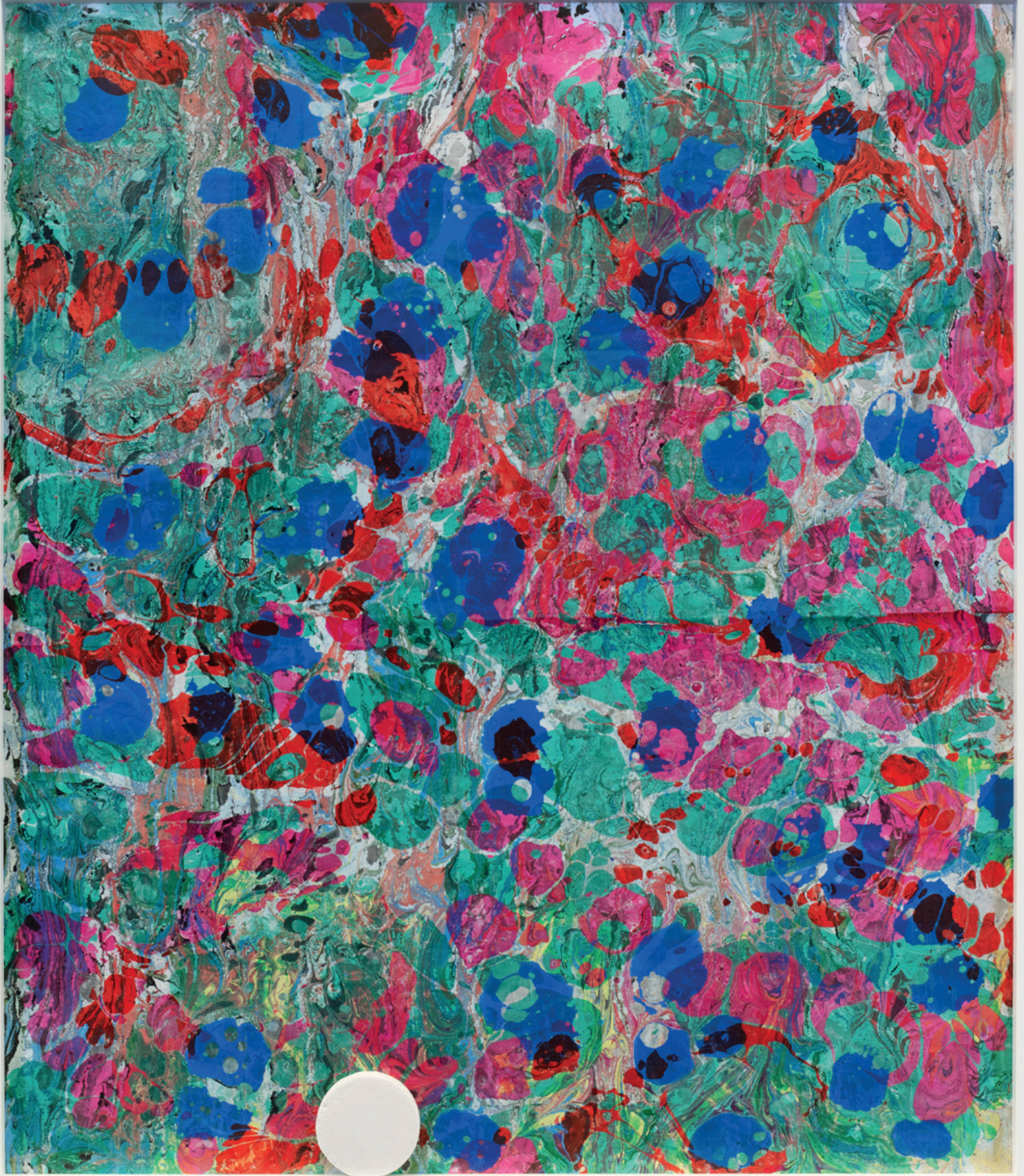
Le Groupe et la Famille, D01 - Gaillard & Claude 2010 - papier à la cuve original et pilule de paracétamol 250 gr - 123 x 143 x 6 cm