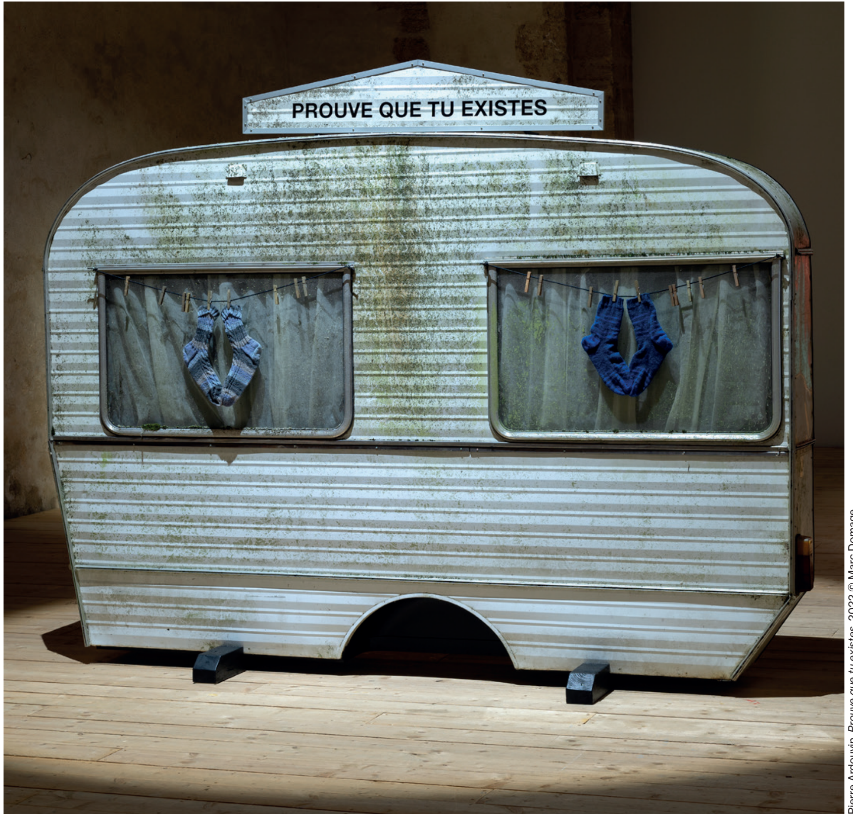
Pierre Ardouvin, Prouve que tu existes, 2022