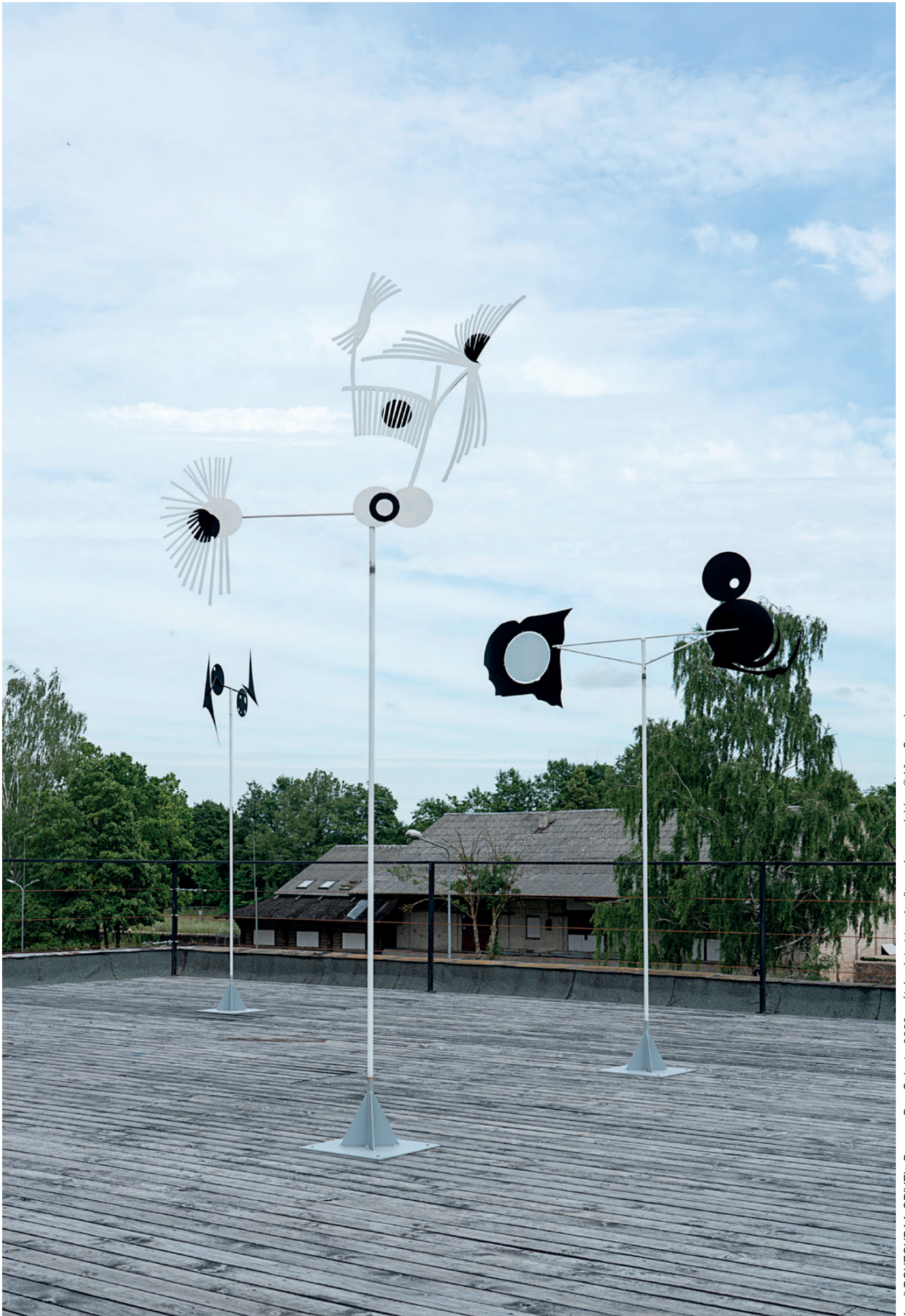
Kamil BOUZOUBAA-GRIVEL, Reverse Don Quixote, 2022, métal peint et tyvek, dimensions variables © Liga Spunde