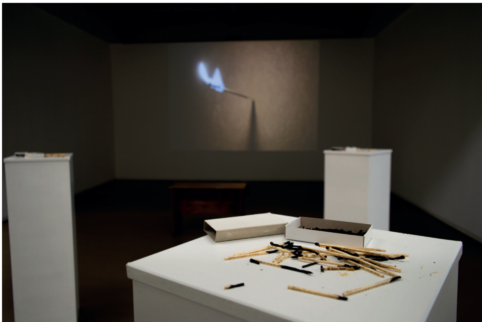
Éloïse LEGA, Allumettes, 2018 – en cours