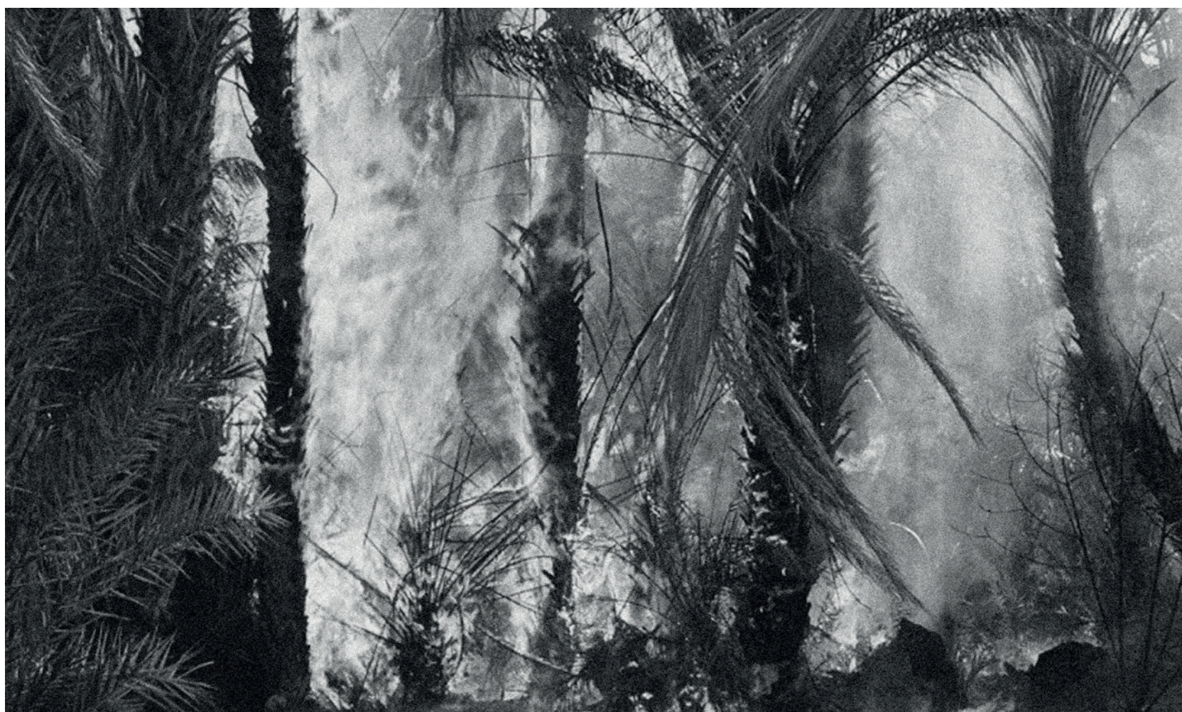
Ouled Shaker, 2024@map pour MEDIAS24