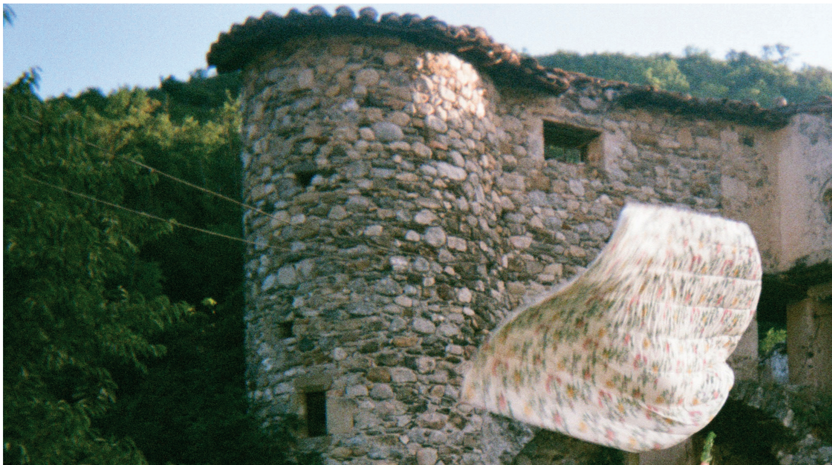
(des noms)

En 2022, elle travaille en tant qu'assistante à la mise en scène sur deux créations : en théâtre, sur Ma Misanthrope, d'Agnès Bourgeois et en danse, sur la nouvelle création de Erika Zueneli, Landfall.