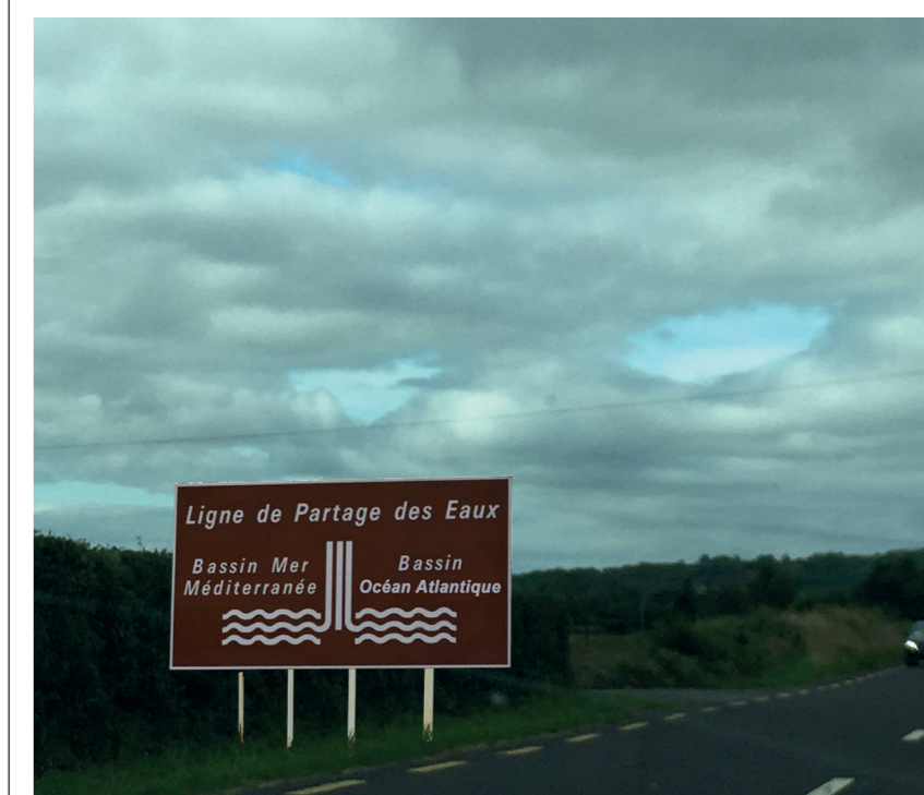
La ligne de partage des eaux © Yasmine El Amri

Yasmine El Amri est née en Margeride. Depuis 2016, elle produit des événements. Ces situations sont une manière pour elle de mettre en terrain sa pratique du texte à travers des dispositifs variés telles que performances, dîners, conférences, discours, garden party ou parties de campagne. Avec ces événements, elle donne à célébrer l'écriture et l'amitié. En 2020, son ambition d'entrer au ministère de l'Infrastructure, l'amène à intégrer le master de création littéraire, avec comme projet l'écriture d'un livre sur l'ambiance, l'aménagement du territoire et la SNCF.